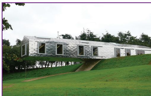
Balancing Barn, Suffolk - Großbritannien Architekt : MVRDV Kunde: Living architecture