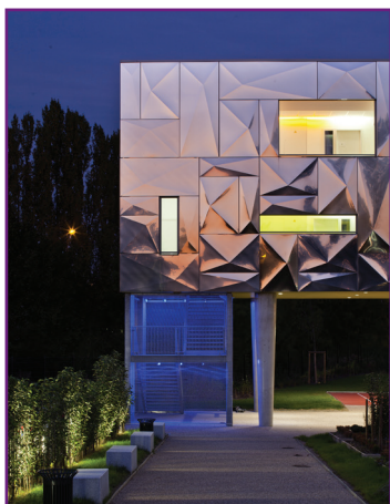
Hotelfachschule (Centre de formation des apprentis hôteliers), Metz - Frankreich Architekt: Bernard Ropa